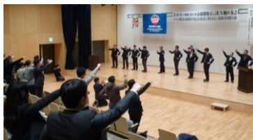
2/4 春闘開始宣言佐久地区集会の様子