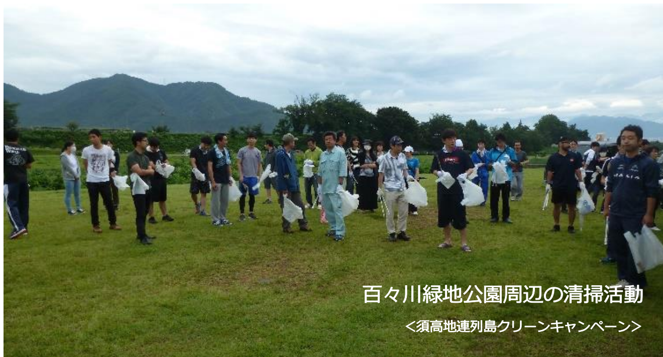
百々川緑地公園周辺の清掃活動

連合長野の活動方針に基づく 2019 年度の「高水地域列島クリーンキャンペーン」は、須高・北信両地連において、構成単組の組合員が参加し、それぞれが設定した日程により昨年同様の地域内清掃活動を実施しました。