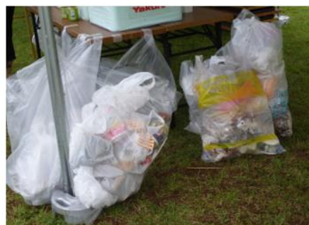
百々川緑地公園周辺の作業風景