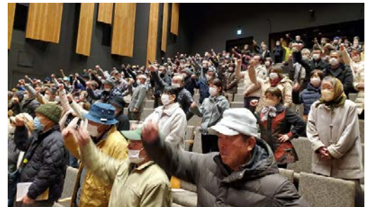
必勝を期して頑張ろう三唱